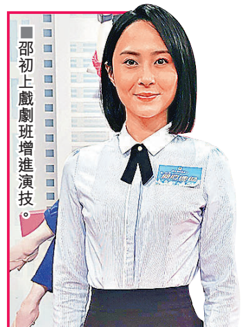
邵初上戲劇班增進演技。