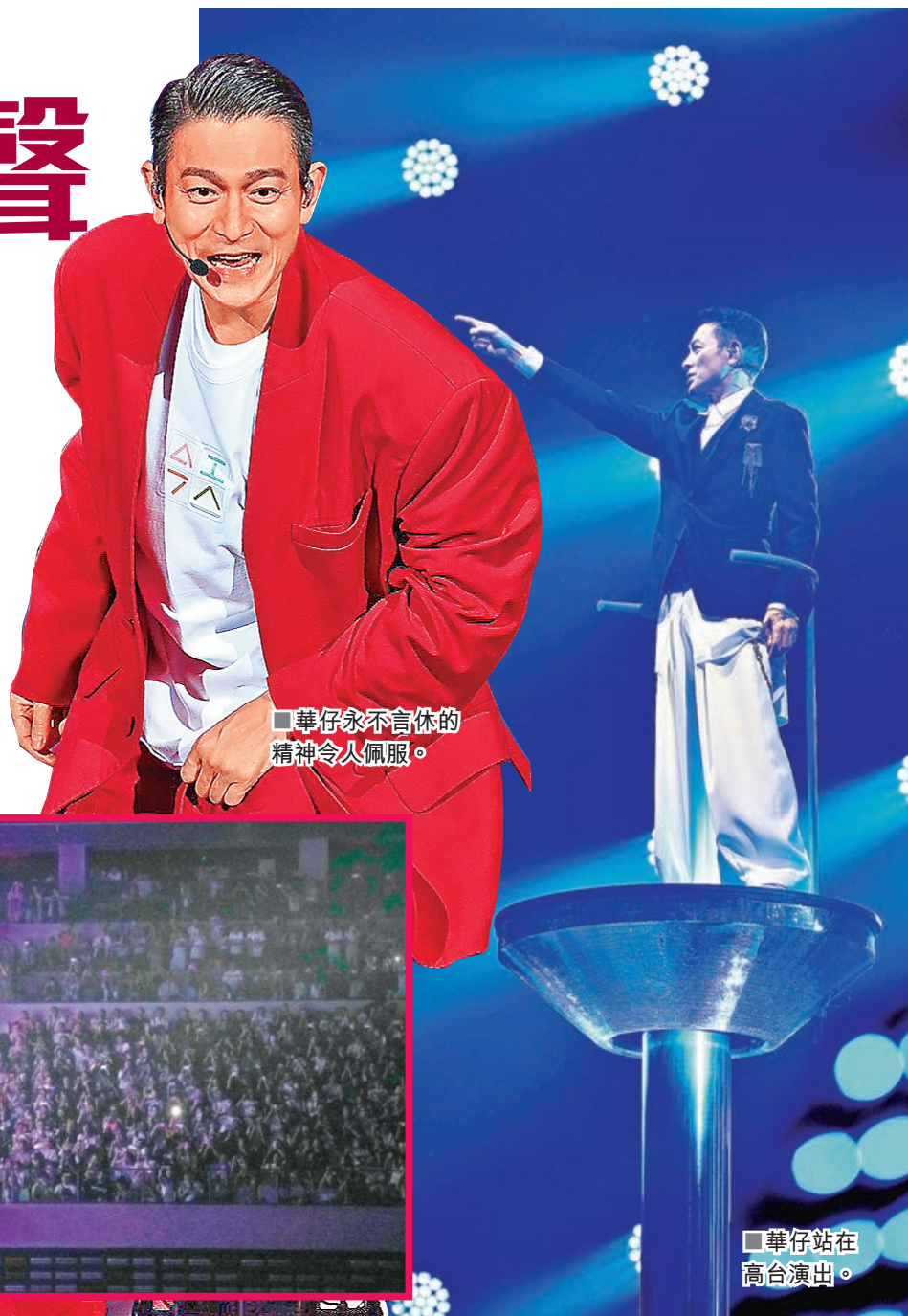
華仔永不言休的精神令人佩服。

最大的一份禮物就是一班Fans唱、作、導炮製的《愛華1萬年》MV，很有心思。問到可覺得Fans很有才華？華仔感恩說：「他們不止有才華，還很『愛華』，每一次聽到他們在場內不停說『劉德華我愛你、劉德華我愛你』，我真的享受他們的聲音，時時刻刻都被他們的舉止感動，Fans所給我的是一份福氣。我相信即使70歲、80歲在台上，他們仍然那麼愛我，所以……我也愛你們。」緊接成都站的還有重慶、杭州、深圳等14場，華仔繼續跟大家「唱」所欲為。