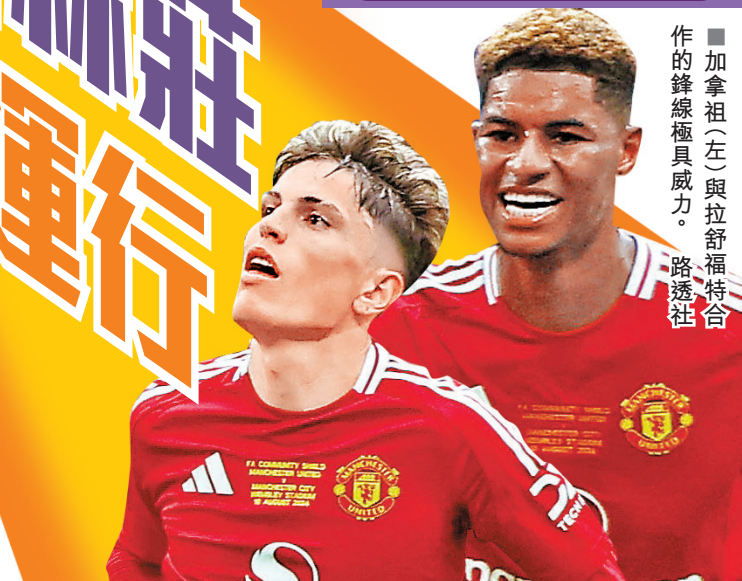
■加拿祖(左)與拉舒福特合作的鋒線極具威力。