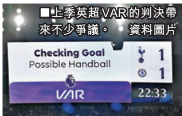
■上季英超VAR的判決帶來不少爭議。資料圖片

現時網民普遍反應正面，包括「終於！踏前一大步」「很好的發展」，但也有持相反意見大潑冷水：「混亂開始喇！認真過癮！」