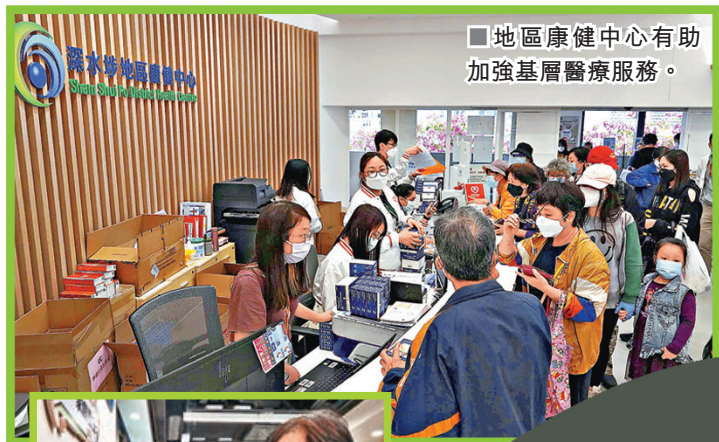
■地區康健中心有助加強基層醫療服務。

港人疫後精神健康狀況備受關注，行政長官李家超去年施政報告提出在三個地區康健中心推出先導計劃，與社區機構合作提供精神健康評估，及早跟進和轉介高風險個案。醫務衛生局昨日宣布，即日起在屯門地區康健中心、油尖旺地區康健站及東區地區康健站，推出「健康心靈先導計劃」，試行在社區層面提供免費精神健康初步評估，被評估為輕微抑鬱或焦慮的服務使用者將獲轉介至非政府機構進一步評估和跟進，及早提供適切支援。