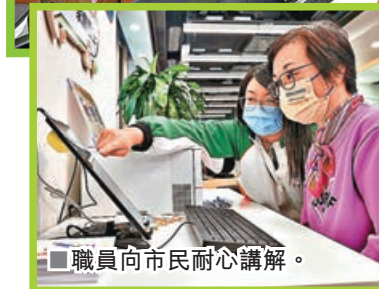
■職員向市民耐心講解。