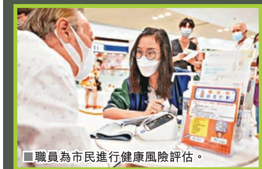
■職員為市民進行健康風險評估。