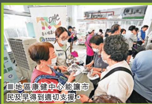
■地區康健中心讓市民及早得到適切支援。

醫務衛生局昨日介紹，先導計劃的服務對象，為三間指定地區康健中心及康健站的18歲或以上受情緒困擾的會員，已接受培訓的職員為有關會員進行健康風險評估時，同步以病人健康問卷（PHQ-2）和廣泛性焦慮症量表（GAD-2），為他們進行初步情緒問卷評估，以了解有否與抑鬱和焦慮相關的情緒困擾風險。