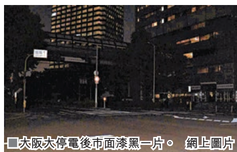
■大阪大停電後市面漆黑一片。

時便利店的燈光也熄滅。京阪電鐵稱由於 停電，京阪本線淀屋橋站至京橋站之間的 上下線，以及中之島線全線暫停首班列 車，合共84部列車延誤，影響約3萬名乘 客出行。JR西日本有學研都市線、大阪環 狀線、東西線、寶塚線部分列車延誤。大 阪市和守口市至少140個交通燈暫停運作， 警方早上需人手指揮交通。