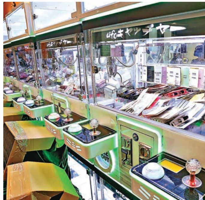
■懷疑冒牌香水放入夾公仔機內，吸引顧客入錢夾取。

根據《商品說明條例》，任何人銷售或為售賣用途而管有冒牌物品，即屬違法，一經定罪，最高可被判罰款 50 萬元及監禁 5 年。市民可致電海關 24 小時熱線 2545 6182，或透過舉報罪案專用電郵賬戶 (crimereport@customs.gov.hk) 舉報懷疑侵權活動。