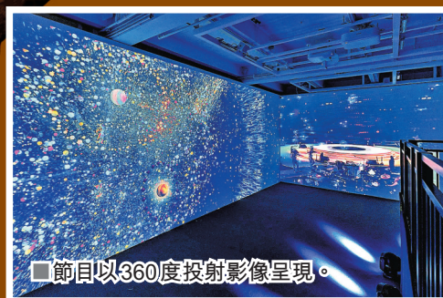
■節目以360度投射影像呈現。