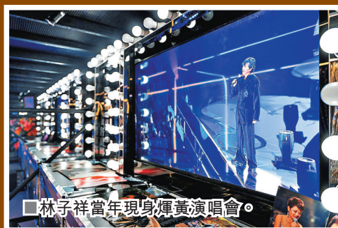
■林子祥當年現身輝黃演唱會。