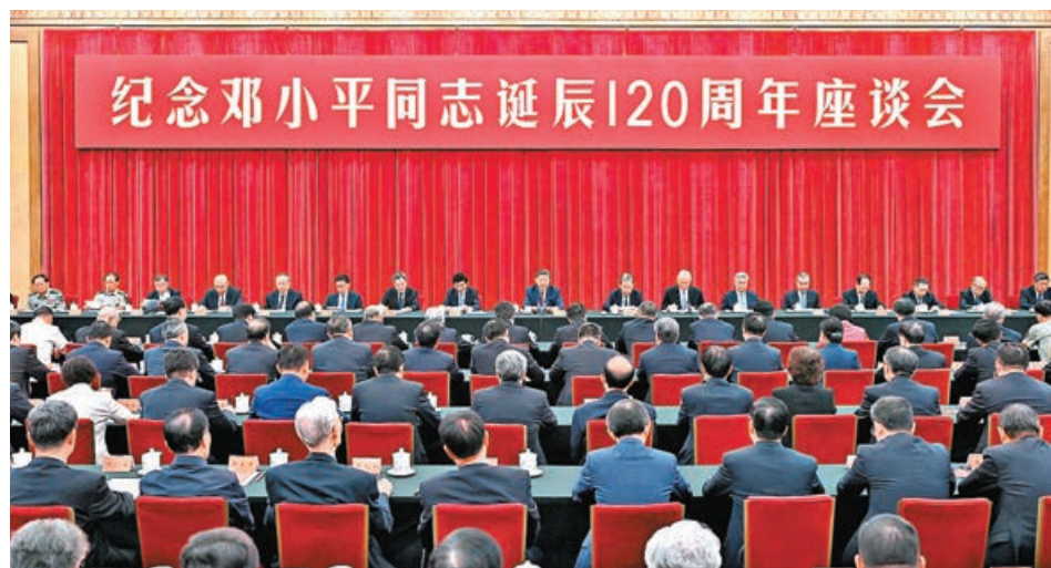
■ 習近平、趙樂際、王滙寧、蔡奇、丁薛祥、李希、韓正等出席紀念鄧小平同志誕辰 120 周年座談會。

中共中央 22 日上午在北京人民大會堂舉行座談會，紀念鄧小平同志誕辰 120 周年。中共中央總書記、國家主席、中央軍委主席習近平發表重要講話。他強調，鄧小平是公認的享有崇高威望的卓越領導人，中國社會主義改革開放和現代化建設的總設計師，中國特色社會主義道路的開創者，鄧小平理論的主要創立者，對黨、對人民、對國家、對民族、對世界作出了突出貢獻，功勳彪炳史冊、永勵後人。