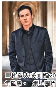
杜羅夫或面臨20年監禁。

根據法國電視一台（TF1）和BFM電視台報道，即時通訊軟件Telegram創始人兼行政總裁、擁有法俄等4國國籍的杜羅夫於上週六（8月24日）在法國巴黎被捕。俄羅斯國家杜馬副主席達萬科夫敦促俄外交部採取行動，設法讓法國釋放杜羅夫。