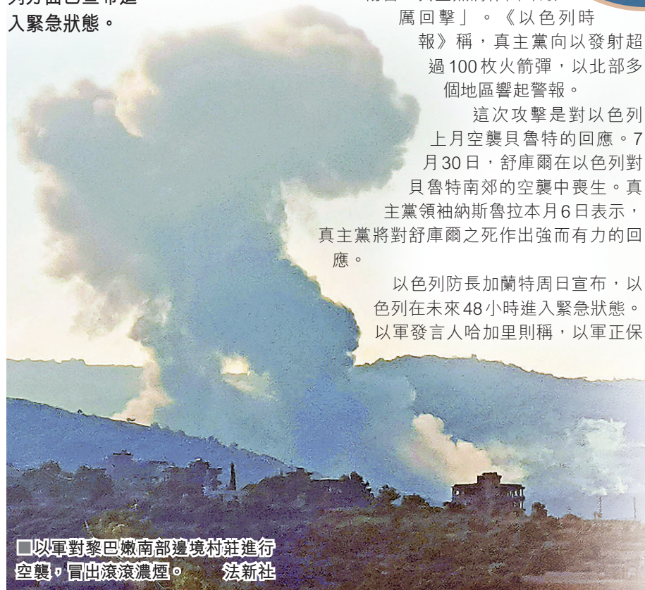
以軍對黎巴嫩南部邊境村莊進行空襲，冒出滾滾濃煙。

另外，新一輪加沙停火談判周末在埃及首都開羅重啟，以色列、美國、卡塔爾和埃及代表參加會議，但未有取得進展跡象。哈馬斯代表團已於上週六（8月24日）抵達開羅，但不會直接參與談判。