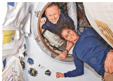
波音「星際客機」太空人巴里（左）及蘇尼仍滯留在國際太空站。