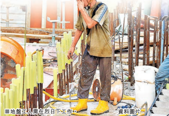
■地盤工友需在烈日下工作。

香港建造業總工會理事長周思傑指出，建造業工友需要長期在酷熱天氣下工作，地盤內的溫度一般較高，建議業界考慮避免在酷熱期間進行「落石屎」等工序，並為僱員提供足夠休息時間。同時，建造業一直出現工期不足的問題，政府亦有責任推動承建商提供「合理施工期」，避免因「趕工」而忽略預防中暑措施。