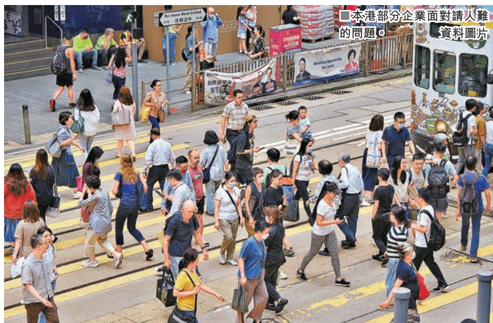
■本港部分企業面對請人難的問題。