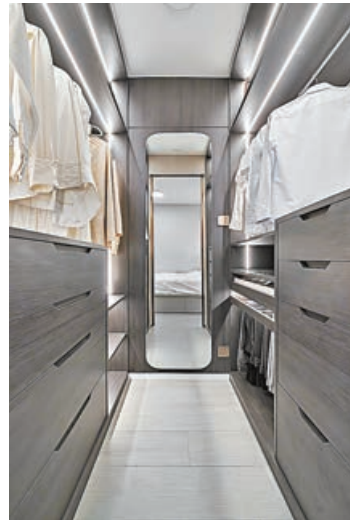
衣帽間兩旁分別放置男女戶主的衣物。

位於北角半山的豪宅寶馬山三房單位，設計整體以清雅的白色和柔和色彩為基調，利用光線營造出空間的明亮通透感。負責項目的ADO CASA設計師善用客飯廳的結構，利用窗戶自然光的角度，配合玻璃材質的櫃子來進行反射，讓整個室內空間煥發出溫潤舒適的氛圍，增強空間的通透感和連結性。