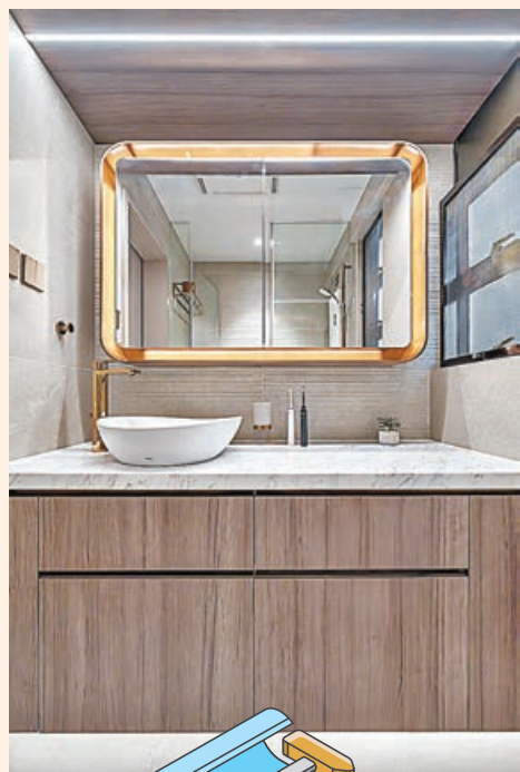
廁所的梳妝鏡十分搶眼。