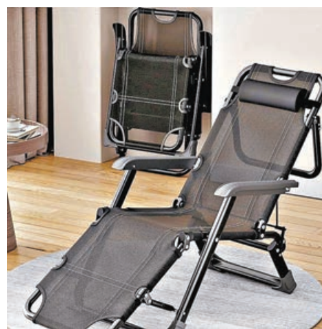
午間小睡後，椅子收起可放在室內一角。