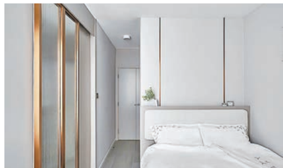
主人房內衣櫃金屬線條裝飾，別具特色。