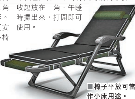
椅子平放可當作小床用途。

睡躺椅外，只要將椅子躺平，就變身為一張小床。椅子免安裝，支架採用優質鋼管加厚牛津布，顏色有黑色和深灰色選擇。平時你更可將椅子折疊收起放在一角，午睡時攤出來，打開即可使用。