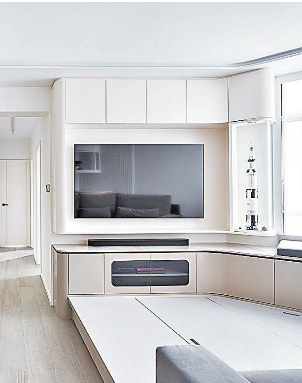
客廳和飯廳善用空間，極簡主義美學淋漓盡致。

此外，客飯廳和主人房都採用相同的材質，營造出設計和空間的統一性。條紋和雲石的組合呈現簡約設計的深度，小量金屬線條裝飾更進一步詮釋空間氛圍。