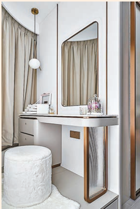
梳妝台設在窗台一角，位又美觀。