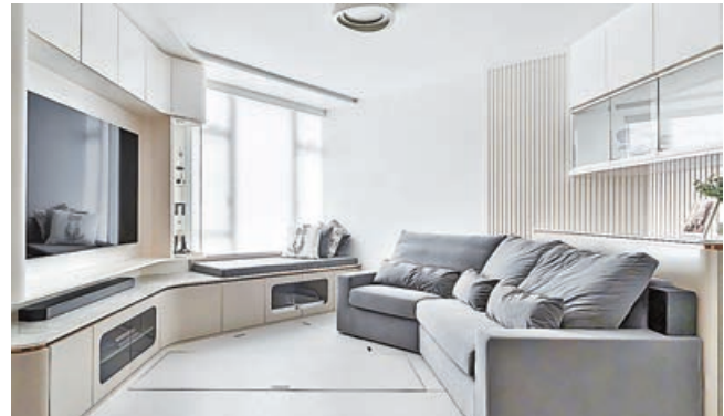
鑽石型客廳，電視櫃、窗台和梳化等傢具無縫連接。