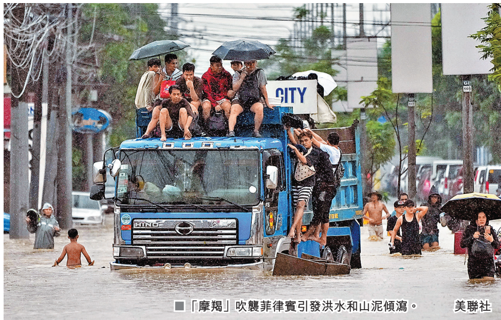
「摩羯」吹襲菲律賓引發洪水和山泥傾瀉。

熱帶風暴「摩羯」昨日移向呂宋北部及有所增強，預計今日進入本港800公里範圍內，隨後靠近華南沿岸再進一步增強，較大機會移向廣東西部至海南島一帶。天文台考慮在今午至晚上發出一號戒備信號，並視乎「摩羯」強度、環流大小及與香港距離，考慮會否發出更高的熱帶氣旋警告信號。受其影響，預計廣東沿岸本周後期天氣會轉壞，風勢會增強，有狂風大驟雨。另菲律賓受「摩羯」肆虐引發洪水和山泥傾瀉造成至少14人死亡，首都馬尼拉需停工停課。