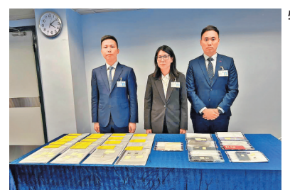
警方展示檢獲的證物。

銀行戶口。警方表示，上半年欺詐案錄得19,987宗，同比升1,154宗或約6.2%，其中電話騙案急升2,723宗或145.5%，而今年新出現的假冒客服騙案錄2,716宗，佔整體電騙升幅99.7%。