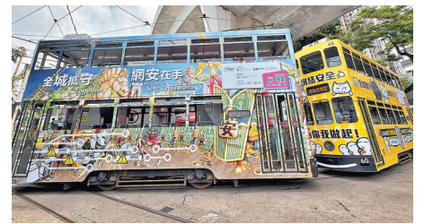
印上宣傳廣告的電車穿梭港島。

由於預測馬尼拉未來兩日降雨量會有50至100毫米，可能引發水浸和山泥傾瀉，為了確保公眾安全，當局宣布大馬尼拉地區今日繼續停工停課，政府緊急救援部門除外。