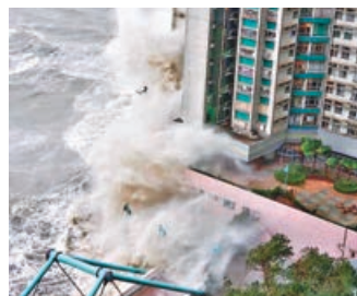
■ 強颱風吹襲，臨海住宅岸邊捲起巨浪。資料圖片