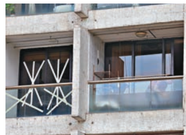
■ 住戶在玻璃窗貼上膠紙，抵擋強風吹襲。資料圖片