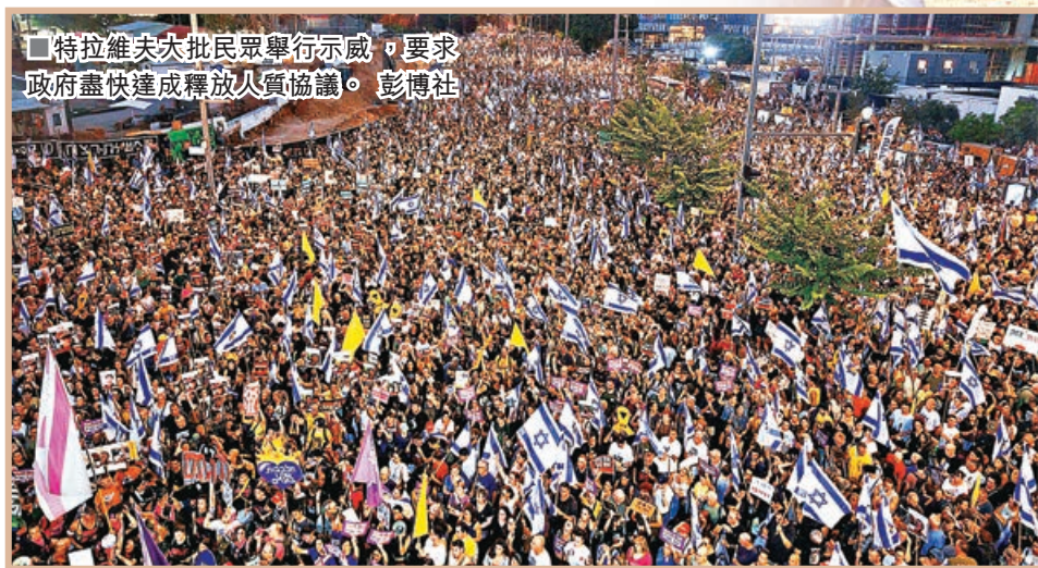
■特拉維夫大批民眾舉行示威，要求政府盡快達成釋放人質協議。

以色列軍方上週日（9月1日）宣布在加沙地帶發現6名人質的屍體，法醫指他們已在數日前死亡，「被近距離多次槍擊殺害。」以總理內塔尼亞胡隨後發聲明，指巴勒斯坦武裝組織哈馬斯「不願進行談判」，但遭到哈馬斯反駁。人質死亡消息在以色列全國引發民憤，當晚全國多達約70萬人上街示威，要求內塔尼亞胡立刻接受交換人質的協議。全國最大工會「以色列總工會」更於周一發動全國罷工，以示聲援人質。