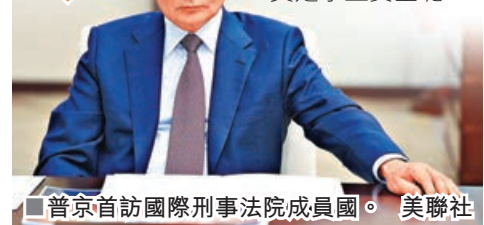
■普京首訪國際刑事法院成員國。

普京上一次訪問蒙古國是在2019年。普京近日在接受蒙古國報章《今日報》訪問時說，「與我們的近鄰和老朋友蒙古國發展全面互利夥伴關係，過去是，現在仍然是俄羅斯歐亞方向外交政策的一個優先事項。我們的雙邊夥伴關係在所有關鍵領域都進展良好，又表示多年來俄羅斯、蒙古國和中國成功地為發展全面互利合作奠定了堅實基礎。」