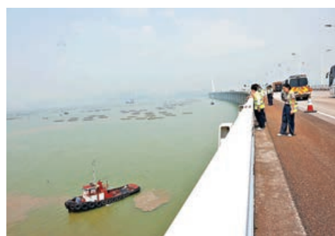
肇事私家車疑越過圍欄墮海，躉船到場打撈。

他指根據車禍現場圖片所見，大橋護欄只有擦撞痕跡，推斷私家車不是直撞向欄杆，而是「跳過」欄杆墮海。以4呎高符合國際標準的欄杆來說，有強大保護性及