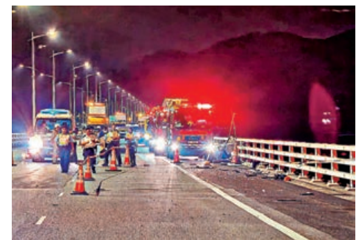
事故之後，路面遺下大量玻璃碎及汽車零件。

警方昨日打撈墮海私家車時同樣遇上淺水問題，因潮退後水深不能容納大型躉船，躉船需要把握漲潮時間駛至現場打撈吊起私家車連走。