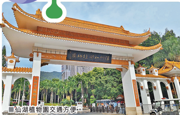
仙湖植物園交通方便。