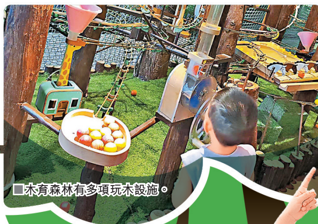
木育森林有多項玩木設施。