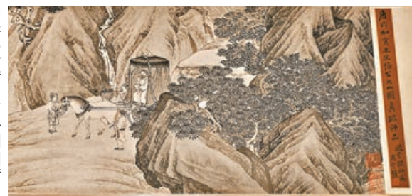
■展品之一為倪端的《聘龐圖》，畫作描繪東漢末年荊州牧劉表請龐德公出山的典故。