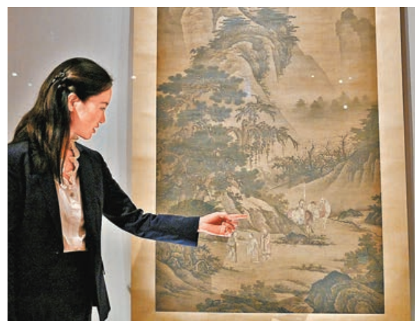
■唐寅《王公拜相圖》局部，為王鏊應詔出山時，唐寅為其餞行而繪。