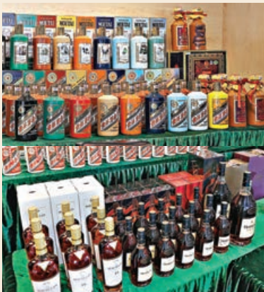
檢獲的假酒包括不同品牌。