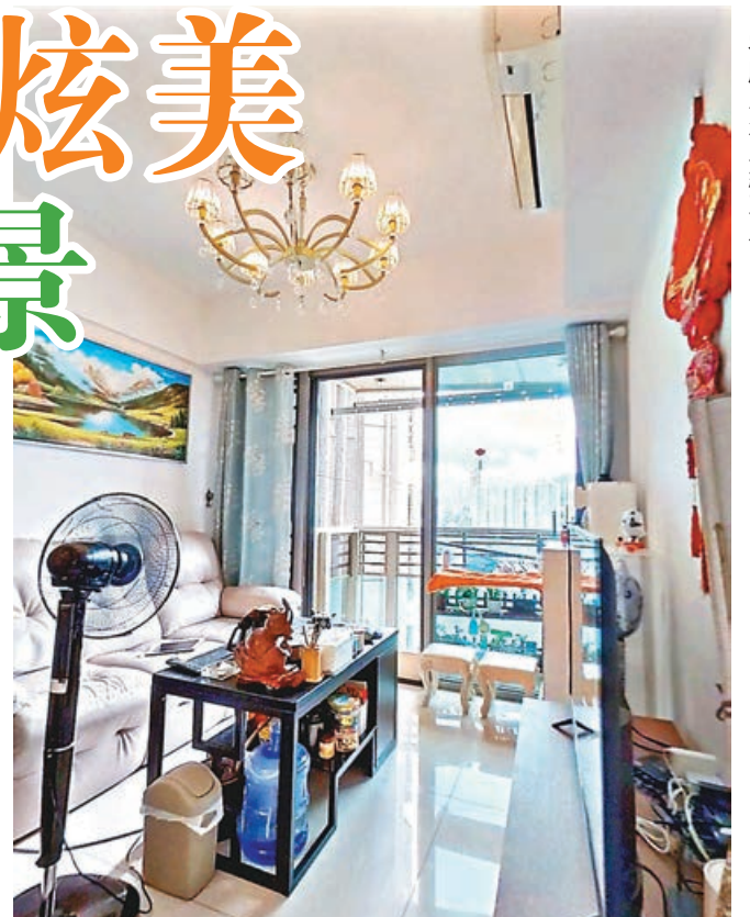
■客廳戶外光線充足。