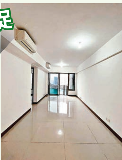
■長方形大廳盡頭是落地玻璃趟門，連接露台。