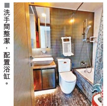
■洗手間整潔，配置浴缸。