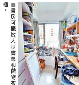
■書房可擺放大型書桌和儲物衣櫃。