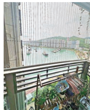
■單位小露台可種植小盆栽。