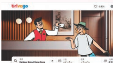
為你比較過百個網站的酒店價格 搜尋交給我們，幫你輕鬆選擇。