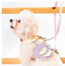
■市集有售Dotisk寵物服飾。

另外，東薈城推出多種禮遇，包括「『里』想派對」消費賞，最高可賺取900元商戶電子現金券及11,000「亞洲萬里通」里數；「CLUB CG『寵』賞」禮遇，CLUB CG會員憑指定餐飲消費即享4倍積分兌換心水獎賞；「特『寵』任務」有獎遊戲，CLUB CG會員及準會員攜同毛孩於場內打卡並掃描二維碼完成任務，即送1,000會員積分。熾熱Pawty氛圍亦伸延至戶外，除Lost Dogs' Disco藝術裝置外，東薈城名店倉更於9、10月一連五個周末帶來首個戶外寵物市集，近30個特色攤位每周輪流登場，涵蓋狗狗服飾、食品、創意手作、日常護理以及手工藝品等等，各位主人可帶毛孩一同選購心水產品，替主子裝扮一番。