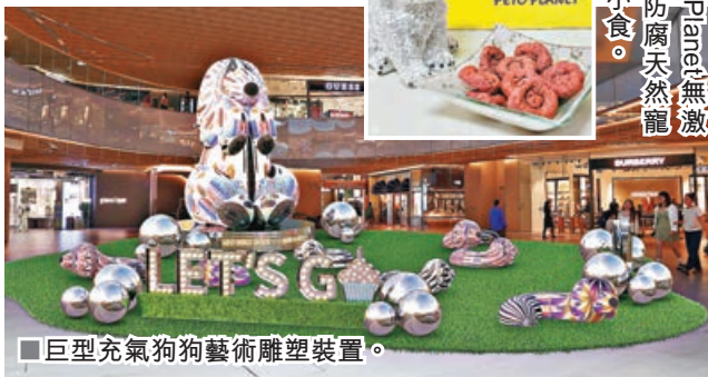
■巨型充氣狗狗藝術雕塑裝置。