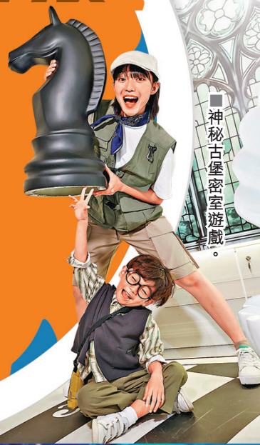
■神秘古堡密室遊戲。

不少人愛養寵物且視如子女般看待，放假更會想帶着毛孩周圍去。但天氣炎熱，戶外活動去得多，都會擔心愛寵容易中暑。適逢有寵主同樂的大型綜合設施「Pet Park」開幕，也有商場大搞主人與毛孩能一同參與的寵物市集，令寵物和主人在鬧市中也享受互動時光。