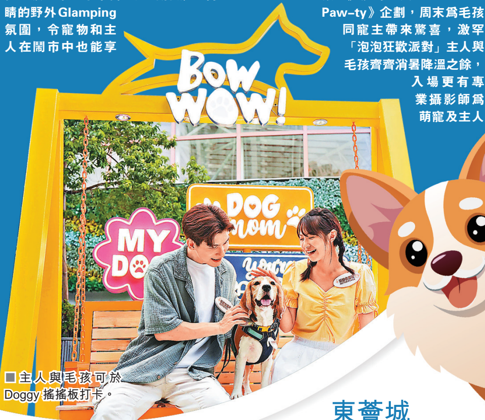
■主人與毛孩可於Doggy搖搖板打卡。