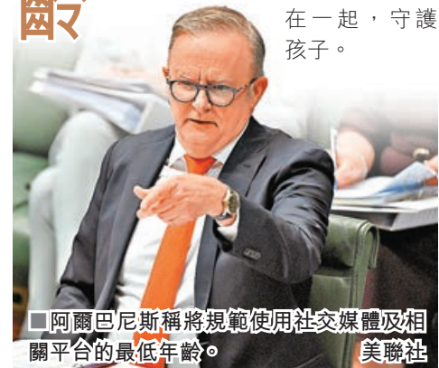
■阿爾巴尼斯稱將規範使用社交媒體及相關平台的最低年齡。

澳洲政府強調,這項由聯邦政府主導的議題,目的在於確保澳洲兒童免受網絡傷害,並協助支持父母和照護者應對網絡風險。此立法也是政府保護年輕人免於網絡傷害的持續努力之一。阿爾巴尼斯指出,社媒正對孩子們造成社會傷害,讓他們遠離真實生活中的朋友和經歷。他認為澳洲的年輕人應得到更好的保護,而政府會與所有澳洲父母站在一起,守護孩子。