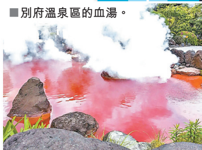
別府溫泉區的血湯。