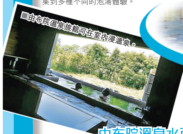
由布院溫泉旅館可在室內浸溫泉。

日本一年四季都可以浸溫泉，而日本眾多溫泉中，位於九州東部的大分縣內，有別府、由布院等很多有代表性的溫泉地，溫泉的泉源數量和湧出量都是日本第一。溫泉的種類也非常豐富，還可以享受砂溫泉、泥溫泉、蒸汽溫泉等一些獨特的溫泉。所以話，去日本浸溫泉，梗係要去大分縣啦！