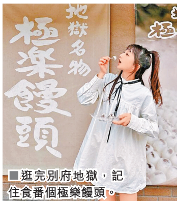
逛完別府地獄，記住食番個極樂饅頭。