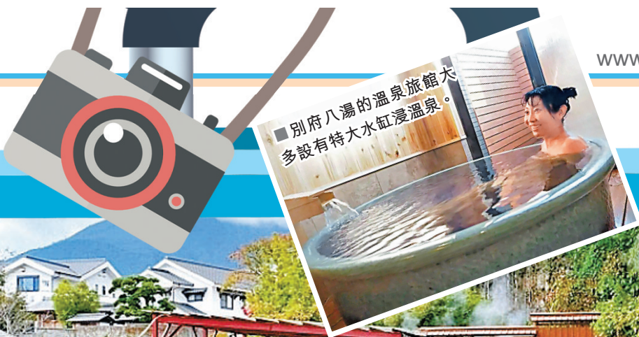
別府八湯的溫泉旅館大多設有特大水缸浸溫泉。