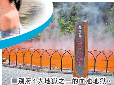
別府4大地獄之一的血池地獄。