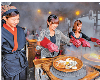
別府地獄遊覽過後，可到工作坊親手炮製地獄蒸醫吓肚。