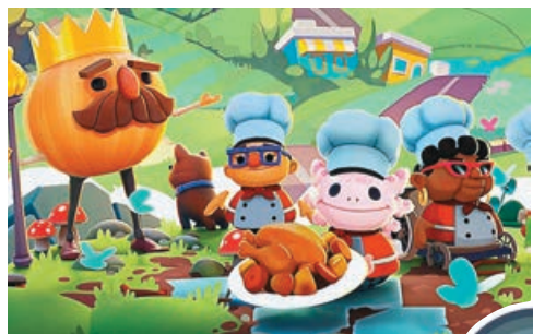
■《胡鬧廚房 全都好吃》成為大廚。

這是一款可1到4人遊玩的遊戲，遊戲目標就是透過簡單的拿起、放下、切菜、洗碗等動作，在各關卡指定的廚房中操作廚師，完成客人指定的料理。單人遊玩時要一人操作兩個廚師分工，多人遊玩時就是要玩家之間自己分工，嘗試在限制時間內以最有效率的方式，完成最高品質的料理。