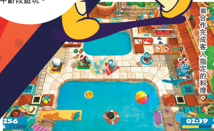
■合作完成客人指定的料理。