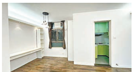
■飯廳一角，旁為廚房。