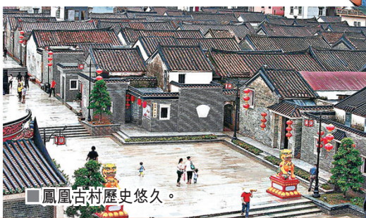
鳳凰古村歷史悠久。