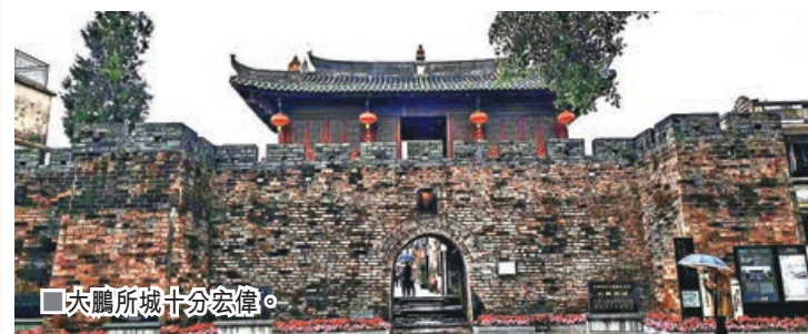
大鵬所城十分宏偉。