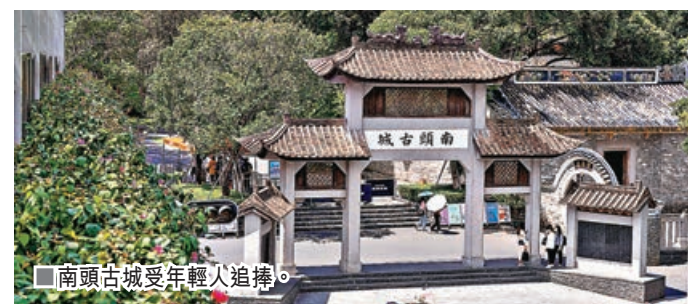
南頭古城受年輕人追捧。

大鵬所城劃分為4條街道，各式各樣的小商戶都紛紛進駐古鎮內，由地道小食、餐廳、手工藝精品及服飾等，同樣可以在這裏找得到。遠道而來，必到大鵬所城海防博物館。由於大鵬所城是明清兩朝時期的重要軍事要塞，因而建立了博物館記下相關事跡。另外，大鵬所城亦有「將軍村」的美譽，而「振威將軍第」就是至今仍保留的明清府院建築，極為珍貴。