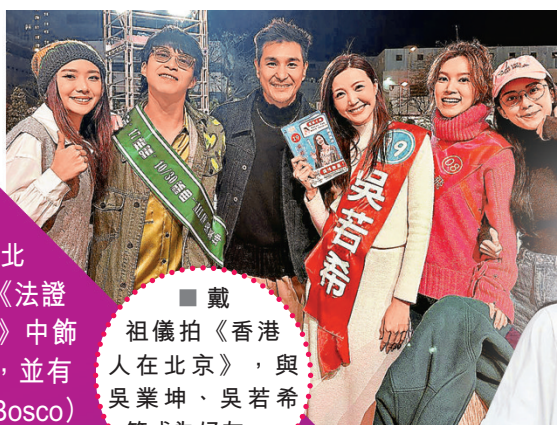
■戴祖儀拍《香港人在北京》，與吳業坤、吳若希等成為好友。