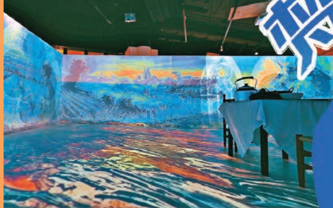
■回歸170年前荷蘭景象

梵谷（梵高）是荷蘭後印象派畫家，知名作品有《星夜》、《向日葵》、《有烏鴉的麥田》等，成為世界名畫家之一。由即日起至10月13日，數碼港商場316空間與藝術科技初創公司Appreciator.io團隊合作，舉行全球首個「梵谷理想村」數位藝術展覽，透過先進3D建構技術與多種程式編寫，展出荷蘭收藏家Kees Rovers提供的「關於梵谷繪畫中出現的物品」，包括古董收藏品，高度還原名畫「吃土豆的人」中的場景，參觀者可以坐在椅子上，欣賞數碼方式呈現的約40幅梵谷名畫，猶如走進遠在荷蘭的梵谷故居，遊歷170