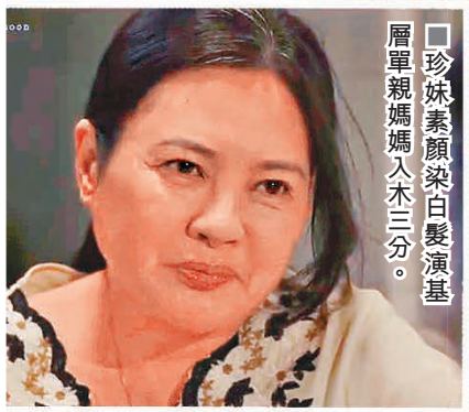
珍妹素顏染白髮演基層單親媽媽入木三分。