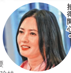
《望月》期間拍攝，雖然在疫拍得開心，珍妹亦

之後就會變得更成熟，更清楚愛情上要什麼。」問珍妹可有向這位戲中女兒分享戀愛經驗？她笑言：「唔使我分享，佢咁大個女！」至於珍妹本身的感情生活，她直言：「無！依家想專心拍一套會令大家睇得開心嘅電影。」