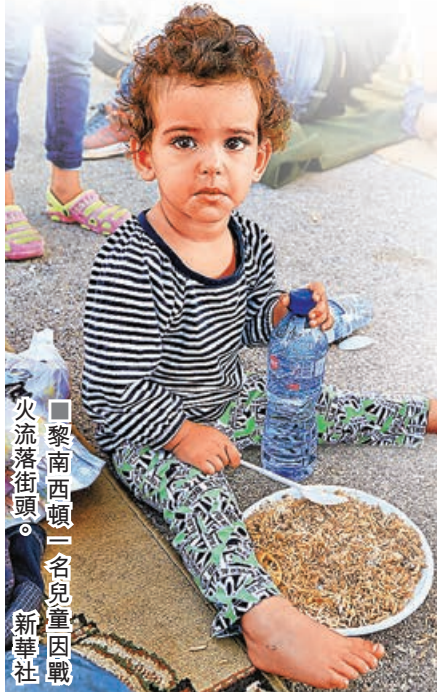
黎南西頓一名兒童因戰火流落街頭。

以色列持續空襲黎巴嫩，美國總統拜登與法國總統馬克龍周三（9月25日）在聯合國安理會緊急會議上，提出黎以雙方臨時停火21天方案。然而以色列總理內塔尼亞胡辦公室未有回應停火呼籲，反而強調已告訴以軍，全力與黎巴嫩真主黨戰鬥。《衛報》披露，美國官員在聯合國偏袒以色列，多次宣稱以色列有「合理安全擔憂」，試圖透過措辭模糊的「外交協議」，阻撓各國呼籲黎以雙方實現永久停火。