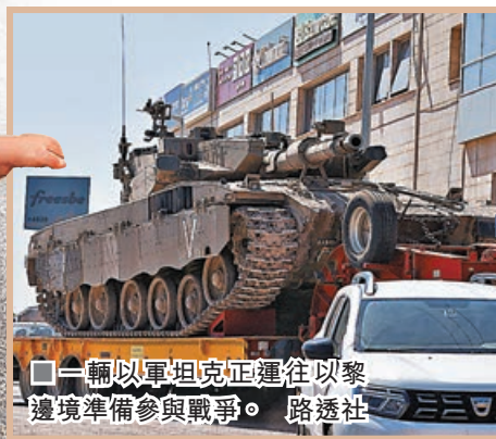
一輛以軍坦克正運往黎邊境準備參與戰爭。