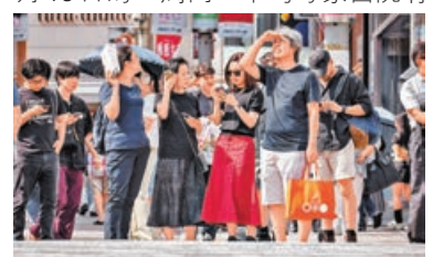
人多密集地點更易感染手足口病毒。圖為東京街頭。

日媒《NHK》報道，根據日本國立傳染病研究所統計，調查全國3,000家醫療機構的結果，截至本月15日的一周內，平均每家醫院有