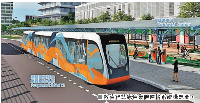
啟德智慧綠色集體運輸系統構想圖。

至於東九龍的項目，亦同步進行多項勘查和設計工作，以及進行工地勘測等，政府會爭取2026年招標及於2027年批出建造合約，期望2033年或之前落成。洪水橋/厦村的項目，第一階段道路工程勘查研究及設計工作已在5月展開，正檢視走線及車站安排、制訂設計方案和影響評估，以及邀請遞交意向書的籌備工作，目標是今年底邀請供應商及營運商遞交意向書，收集有關系統特性、營運能力、維修保養要求等意見，敲定系統及基礎設施的具體要求和設計，爭取2026年內招標。