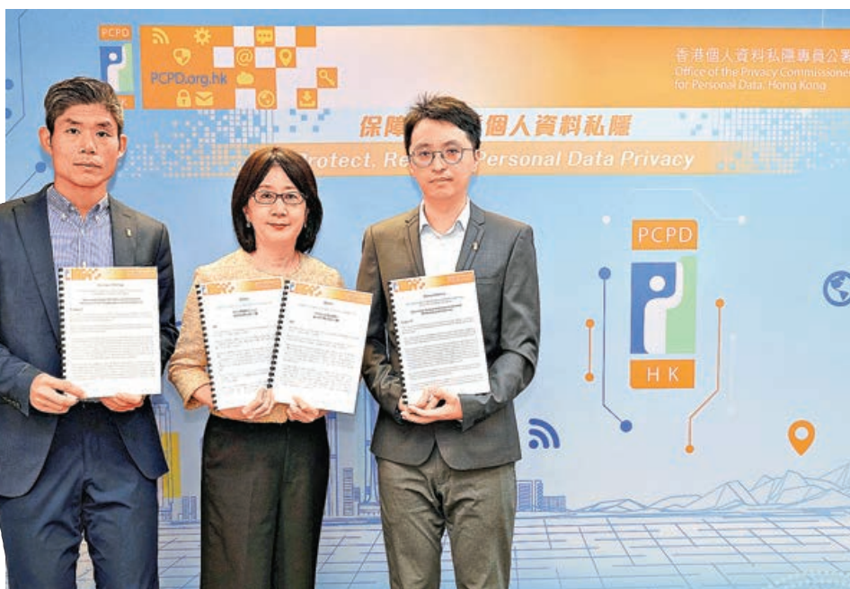
■私隱專員公署已去信領英了解有關情況。

擁有352萬香港用戶的職場社交媒體平台LinkedIn（領英）早前被揭發在未更新使用條款前、無主動知會用戶的情況下更新私隱政策，預設用戶在平台上的個人資料和內容，可供平台用作訓練生成式人工智能（AI）模型創作內容。個人資料私隱專員公署昨發新聞稿對事件表示關注，並已去信領英，關注相關設置是否正確反映用戶的意願，以及提醒領英用戶關閉相關的授權。