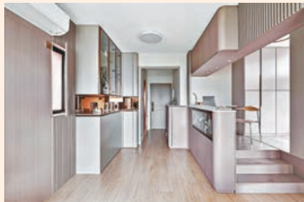
■ 玄關位左右兩旁的同色系吊櫃、裝飾櫃和鞋櫃互相呼應。