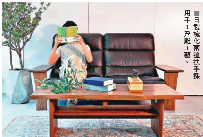
■ 日製梳化兩邊扶手採用手工浮雕工藝。

100% 日本製造的威風堂梳化，其背部三段不同斜度，打造極上舒適坐感，頭頸腰完全能承托。木扶配上彎曲邊沿，加上工匠精心打造的手工浮雕，為你創造意想不到的木系體驗！