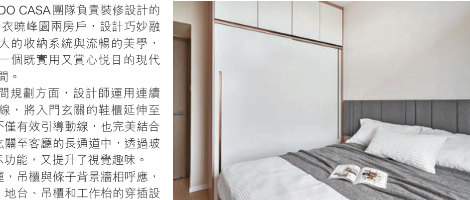
■ 主人房展示了收納功能與美學的平衡。

整體設計強調收納功能與美學的平衡，透過精心的空間規劃和材質運用，為戶主打造了一個既舒適又具美感的居住環境，完美詮釋了現代生活中功能與藝術的和諧共存。