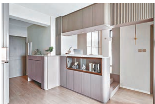
■ 設計師大膽地將飯廳與工作室合併。