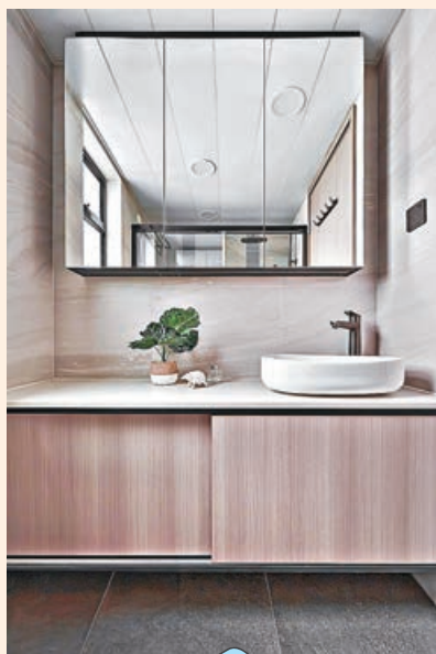
■ 廁所的玻璃化妝鏡櫃，美觀實用。