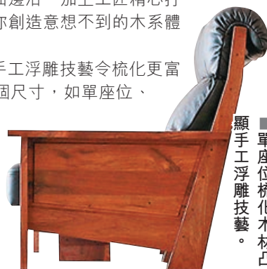
■ 單座位梳化木材凸顯手工浮雕技藝。

威風堂梳化的手工浮雕技藝令梳化更富立體感，梳化有多個尺寸，如單座位、雙座位和三座位；多種木材，如胡桃木、白橡木和黑櫻桃木；多種面料，如棉麻布料、防抓防水布和真皮(全牛皮)等。