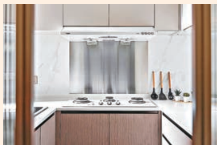
■ 廚房廚枱、爐頭、抽油煙機都以白色為主調。