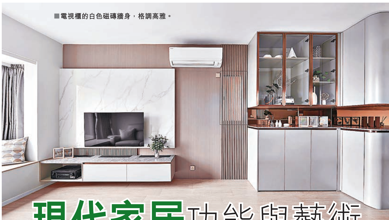
■ 電視櫃的白色磁磚牆身，格調高雅。