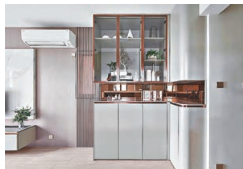
■ 吊櫃與條子背景牆十分配搭。