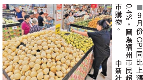
■9月份CPI同比上漲0.4%。圖為福州市民超市購物。

非食品價格由上月同比上漲0.2%轉為下降0.2%，影響CPI同比下降約0.19個百分點。非食品中，能源價格下降3.5%，降幅比上月擴大2.5個百分點。扣除能源的工