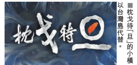
■「枕戈待旦」中的小橫以台灣島代替。

時備戰的場景。可以說，「枕戈待旦」便是如今東部戰區的狀態，作為對台軍事鬥爭準備的主要戰區，東部戰區也絕對能做到「全時待戰、隨時能戰」。戰訓視頻就是想要告訴台灣當局，解放軍已做好了完全準備，台灣當局敢觸碰底線，解放軍就能隨時劍指台灣，「一聲令下，解放軍就能夠以雷霆之勢解決台灣問題」。