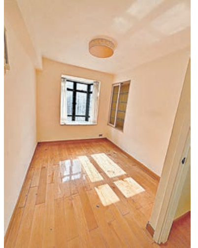
長方形睡房樓底夠高。