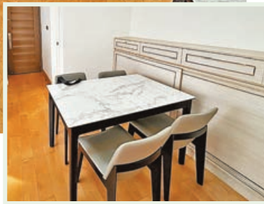
飯廳可放得落4人餐桌。