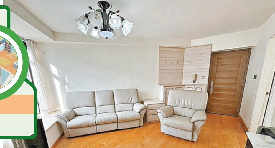
鑽石廳設計擺放傢俬考心思。