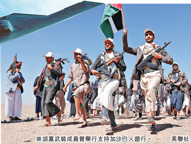
■胡塞武裝成員曾舉行支持加沙巴人遊行。

美國國防部長奧斯汀周三（10月16日）發表聲明稱，美軍當天出動「B2」隱形轟炸機，襲擊伊朗支持的也門胡塞武裝，精確打擊其控制地區的5個地下武器庫。奧斯汀稱，今次襲擊是在美國總統拜登授權下進行，旨在進一步削弱胡塞武裝，展示美軍具備全球打擊能力，能夠隨時隨地對目標實施打擊。