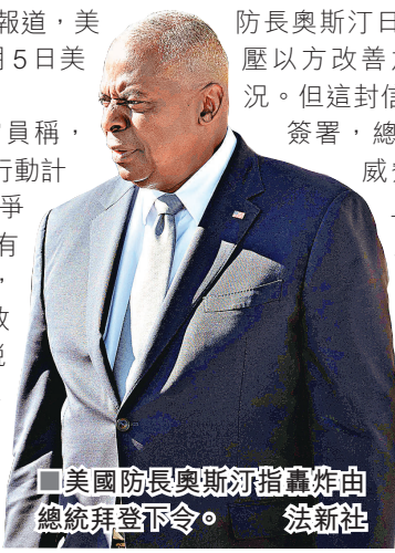
■美國防長奧斯汀指轟炸由總統拜登下令。

分析還指出，美國國務卿布林肯和防長奧斯汀日前致函以國政府，施壓以方改善加沙地帶人道主義狀況。但這封信並未由拜登或哈里斯簽署，總統與副總統均未公開威脅要切斷對以軍援，且信中要求以方允許更多人道援助進入加沙的最後期限，已是美國大選之後。距離美國大選僅剩約3周，中東局勢雖並非多數選民最關心的議題，但仍是影響選情的最大不確定因素之一。