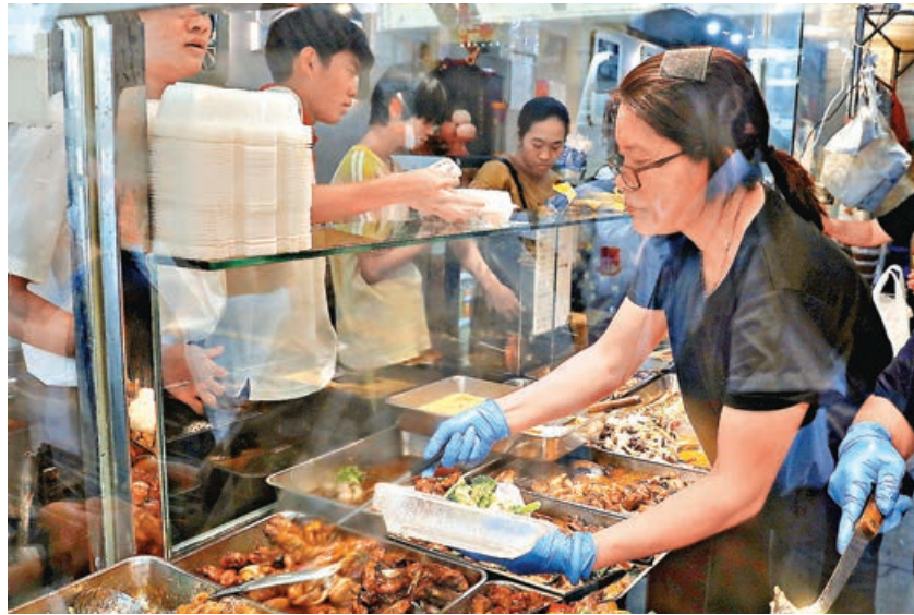
■透明膠飯盒於外賣時仍能使用。

俗稱「走塑」的管制即棄膠餐具和其他塑膠產品的法例今年4月22日生效，法例賦予的半年適應期昨日正式屆滿，今日起食肆堂食或外賣提供發泡膠餐盒、膠刀叉、膠飲管、膠攪拌棒等均屬違法，商店亦禁止販售。本報記者昨日巡查佐敦一帶多間食肆，大部分餐廳已提前轉用環保餐具，但個別小店仍使用受管制的膠餐具，亦有食肆有大量膠餐具存貨。不少市民趁最後一日搶購塑膠一次性餐具，留作日後自用。記者亦發現，有自稱為合格的環保餐具，疑似含有受管制的塑膠成分，隨時令食肆負責人誤墮法網。