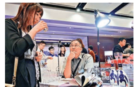
■香港國際美酒展下月舉行。

她指從市場長期發展角度來看，減稅措施可增加就業機會和促進貿易，進一步鞏固香港作為區內酒類貿易樞紐地位。