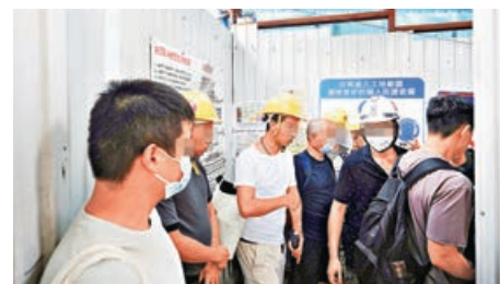
外勞慘遭剝削。資料圖片

至於約滿後續約是否不用再付中介費？中介亦含糊其辭稱「勞工處規定外勞每年要付幾千元勞工費。」惟在現行法制下並無勞工費概念，勞工處也不會每年收取「幾千元勞工費」。