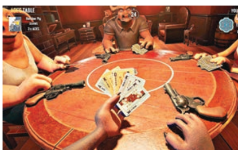
■酒桌上的撲克牌遊戲。