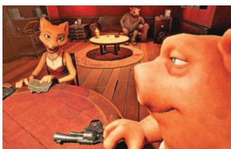
■玩家間的「勾心鬥角」。

遊戲共有撲克牌與骰子兩種模式。在撲克牌模式中，場上有6張K、6張Q、6張A和兩張小丑牌。每回合選定一個牌型為真牌，其他牌型為假牌，而小丑牌可以是任何牌型。四位玩家將輪流出牌並聲明牌型，所出牌必須為最多3張真牌。而當玩家出牌時，他們可能會在真牌中混入假牌。如果懷疑有人在撒謊，下家可以隨時對上家發起質疑。質疑成功則撒謊者要進行俄羅斯輪盤（用一把5發空彈一發實彈的左輪手槍對自己射擊），質疑失敗則由提出質疑者進行。進行完俄羅斯輪盤後，牌局將重置，遊戲繼續進行，直至剩下一個最終贏家。《Liar's Bar》提供了身歷其境的酒吧模擬體驗，鬥智鬥勇的豪賭遊戲令人血脈賁張。目前遊戲正處於搶先體驗階段，製作方仍在根據玩家的遊戲反饋積極嘗試增加新的玩法和內容，目前46元的定價也將在正式版推出時上漲。喜歡這類酒桌社交遊戲的玩家不如早買早享受，不過遊戲目前不支援繁體中文。