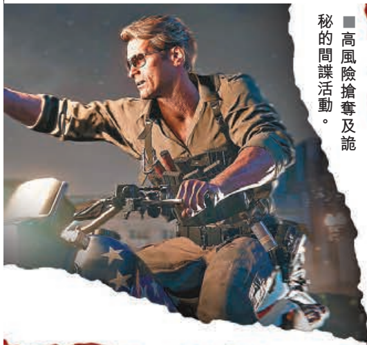
■高風險搶奪及詭秘的間諜活動。

本周最受矚目的新遊戲無疑是暢銷第一人稱射擊遊戲的續作《決勝時刻：黑色行動6》。本次遊戲製作團隊將重點放在傳統的回合制殭屍模式，還加入第三人稱視角，在滿足死忠粉絲與吸引新玩家之間做了巧妙平衡，相信能夠給玩家帶來酣暢淋漓的遊戲體驗。