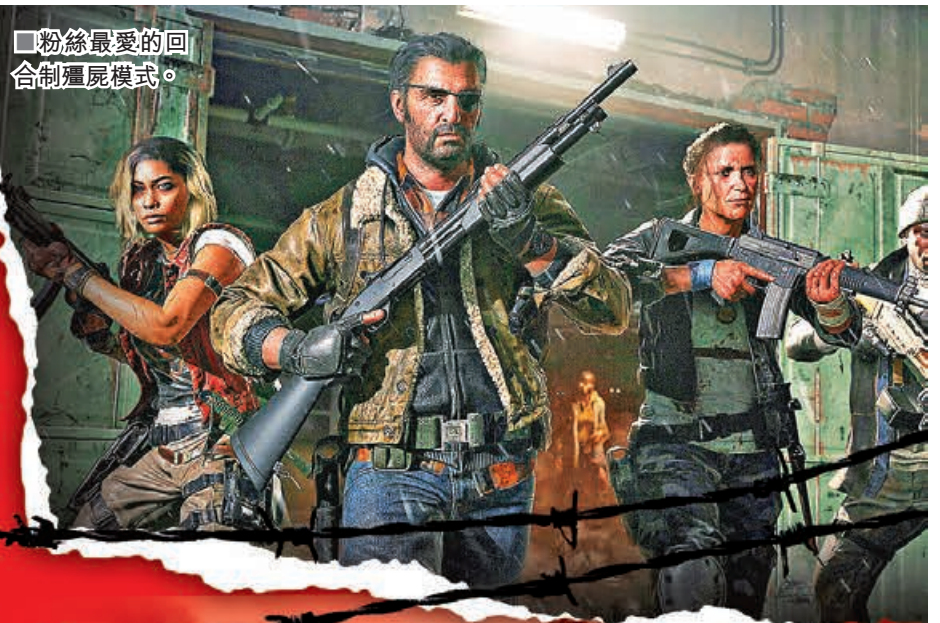
■粉絲最愛的回合制殭屍模式。

本周最受矚目的新遊戲無疑是暢銷第一人稱射擊遊戲的續作《決勝時刻：黑色行動6》。本次遊戲製作團隊將重點放在傳統的回合制殭屍模式，還加入第三人稱視角，在滿足死忠粉絲與吸引新玩家之間做了巧妙平衡，相信能夠給玩家帶來酣暢淋漓的遊戲體驗。