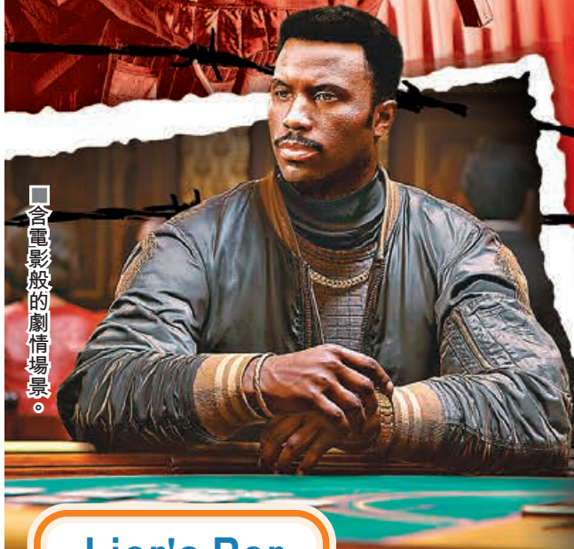
■含電影般的劇情場景。