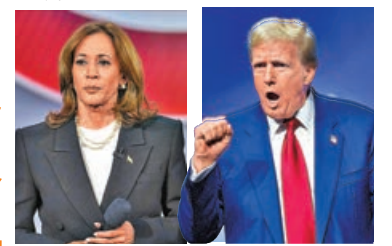
■特朗普 (右) 與哈里斯都在 TikTok 開設賬號吸引首投族。

為吸引年輕選民，哈里斯和特朗普各自出招。哈里斯競選團隊聘用多名年輕人，負責緊跟 TikTok 影片編輯風格和音樂流行趨勢，製作關於墮胎權和環保等議題的影片，還不時攻擊特朗普說謊。特朗普競選團隊則主要用充滿緊迫感的音樂，專攻移民和經濟議題。