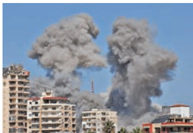
■黎巴嫩古城提爾被炸，市內冒出濃煙。

真主黨則公布已升級對以色列的攻擊，首次使用精確導彈和新型無人機，打擊目標是以色列特拉維夫郊區一間軍工廠。以軍證實有 4 枚飛行物從黎巴嫩發射，攔截了其中兩枚，一枚落入空曠地區，另一枚落入特拉維夫郊區，無迹象顯示有防禦設施被擊中。