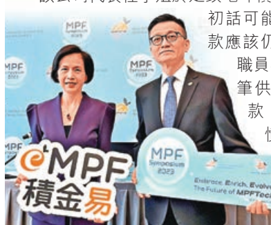
積金易平台已正式投入運作。