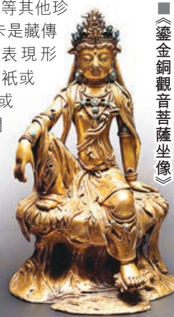
鎏金銅觀音菩薩坐像

此外，今次展覽特別設置了一個多媒體藝術教育展示區，當中包括有原裝西遊記的展示部分，博物館委託設計師及團隊以動畫演繹唐三藏取西經的故事，及其對中外文化交流的貢獻，包括演繹出唐三藏走過的取經及回程路線、古今對比的地名及旅途上的故事，生動傳神演繹真正歷史上的西遊記。