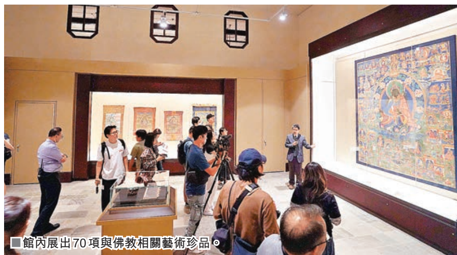
館內展出70項與佛教相關藝術珍品。