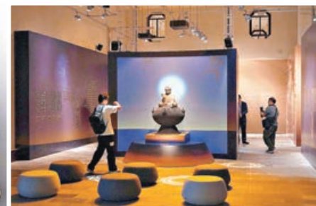
多媒體展區介紹佛學典故。