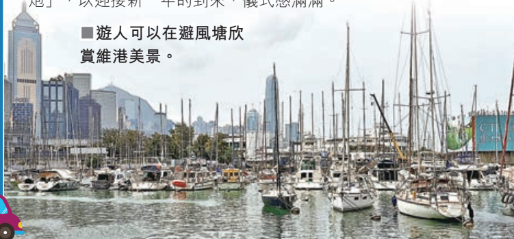
■遊人可以在避風塘欣賞維港美景。

沿着海濱長廊西行，還有一處特別的標誌性建築——「怡和午炮」。從 19 世紀 60 年代起，午炮會於每日正午鳴響，延續至今日成為了香港特別的報時傳統。公眾可於每日中午 12 時來此觀賞鳴炮，隨後將開放場地 30 分鐘供遊客近距離觀賞禮炮及打卡拍照。此外，在每年的除夕夜，午炮還會於午夜特別鳴響「子夜禮炮」，以迎接新一年的到來，儀式感滿滿。