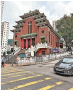
■中式建築風格的西方教堂。

銅鑼灣除了有鱗次櫛比的高樓大廈，也不乏一些別具特色的建築。連結怡和街和禮頓道的行人天橋早在 2002 年被美化成「奧運橋」。天橋共有五條樓梯，分別被刷成了紅、綠、黑、黃、藍的奧運五環色彩，每級階梯上還標有每一屆奧運會的舉辦地點及年份。其中一條樓梯的階梯更被依次刷上了「奧運五環色彩」，成為了社交平台上著名