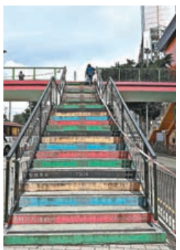
■每級階梯都標有歷屆奧運會的舉辦地點及年份。

銅鑼灣除了有鱗次櫛比的高樓大廈，也不乏一些別具特色的建築。連結怡和街和禮頓道的行人天橋早在 2002 年被美化成「奧運橋」。天橋共有五條樓梯，分別被刷成了紅、綠、黑、黃、藍的奧運五環色彩，每級階梯上還標有每一屆奧運會的舉辦地點及年份。其中一條樓梯的階梯更被依次刷上了「奧運五環色彩」，成為了社交平台上著名