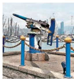
■午炮鳴響後，遊客可以進入場內參觀。

銅鑼灣避風塘是香港歷史上第一個避風塘，政府更於 2022 年在此打造名為「活力避風塘主題區」的海濱長廊。主題區面積約 10,900 平方米、長約 715 米，其中有 90 米的路段採用了無欄杆的階梯式沿岸設計，為市民提供了一條「海岸堤階」，旨在拉近遊人與水體的距離，從而可以更加無阻地欣賞避風塘和維港落日景致。此外，主題區還設有許多戶外桌椅和遮陽設施，也有全日開放的寵物友善場地，實屬周末消閒、情侶拍拖的好去處。