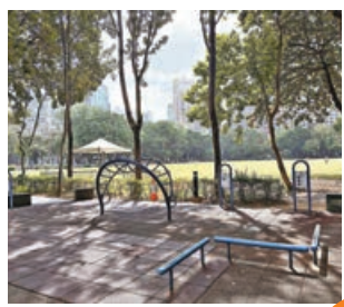
■在維園感受「公園 20 分鐘效應」。

公園中心地帶還有一片面積約兩公頃的中央草坪，是公眾休憩野餐的熱門點。天氣好時，在茵茵綠草之上席地而坐，閉目傾聽林間的鳥鳴、輕嗅泥土的芳香，好不愜意！