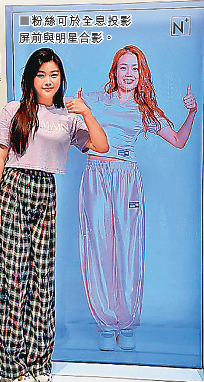
■粉絲可於全息投影屏前與明星合影。