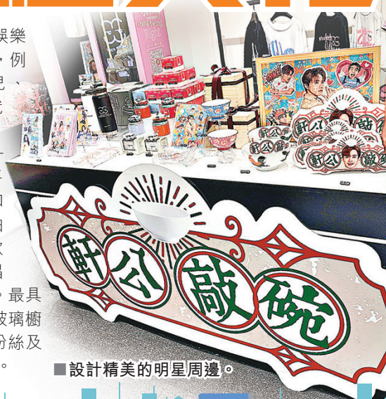
■設計精美的明星周邊。

英皇娛樂是由 1999 年成立的本土演藝娛樂公司，不少本地當紅藝人都孵化於此，例如陳偉霆、古巨基、李克勤、容祖兒、Twins、張敬軒等。早在 8 月，英皇娛樂就於銅鑼灣時代廣場對面開設了一間集打卡、娛樂、零售於一身的期間限定概念店——「0 effect」。樓高 3 層，佔地約 6,000 平方呎，每層都設有不同的主題，包括展示知名歌手經典演唱會的舞台服飾、全息投影拍照打卡屏、Snapiro 自拍亭等；還設有各款設計精美的藝人周邊產品、限量版黑膠唱片、扭蛋機、閃卡機等，內容不定期更新。最具特色的是在入口處設有「音樂直播專區」玻璃櫥窗，定期由來自旗下的藝人現場開 live 與粉絲及行人互動獻唱，為大家帶來視聽享受。