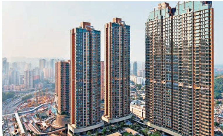
■元朗 GRAND YOHO 兩房戶獲新婚夫婦即睇即買。 資料圖片

中原地產元朗教育路分行副區域營業經理溫旭銘表示，分行新近促成元朗翹翠峰5座高層F室交易，單位實用面積667平方呎，三房間隔，開價700萬元，議價後以663萬元成交，實用呎價9,940元。買家為區內家庭，一直租樓，因為想小朋友於固定居所健康快樂地成長，決定上車自置