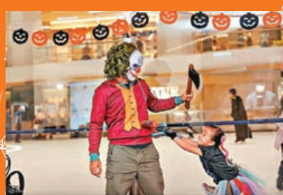
■小丑角色頗受小朋友歡迎。

太古城中心冰上皇宮的「冰上嘩鬼遊樂園」回歸，與家人朋友於溜冰場上狂歡萬聖節，悉心打扮暢玩之餘，場內更設有多項特別節目，令你感受濃濃的節日氣氛。萬聖節當日將有Trick or Treat活動，溜冰人士可與在場職員大玩Trick or Treat可獲糖果一份，更能感受濃濃的節日氣氛！門票115元。