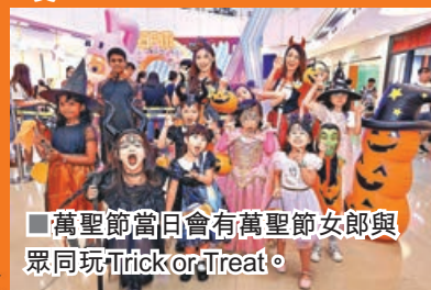
■萬聖節當日會有萬聖節女郎與眾同玩Trick or Treat。