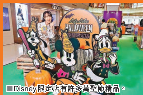
■Disney限定店有許多萬聖節精品。

荃灣廣場現正舉行盛大的萬聖節狂歡，同賀萬聖節！當中最矚目必然是全港最齊的《怪誕城之夜》新品、逾300款迪士尼精品