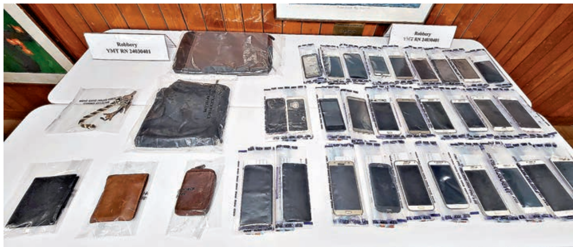
警方在疑犯寓所檢獲大量手機及多個銀包。

一名機動部隊休班男警長前日(2日)凌晨約2時，在油麻地街頭突被一名持「行街紙」的36歲巴勒斯坦籍男子搶銀包，事主反抗及表明警察身份，惟對方未予理會更揮刀多次刺向警長頸部及手腳，期間有途人一度嘗試勸阻及用手機拍下過程，劫匪其後逃去。警方事後經調查，同日以「行劫」及「襲警」罪拘捕該疑犯，並在其住所搜出大量銀包及手提電話，初步不排除疑犯專在深夜趁市民疲倦及警覺性低時，帶備利器犯案。