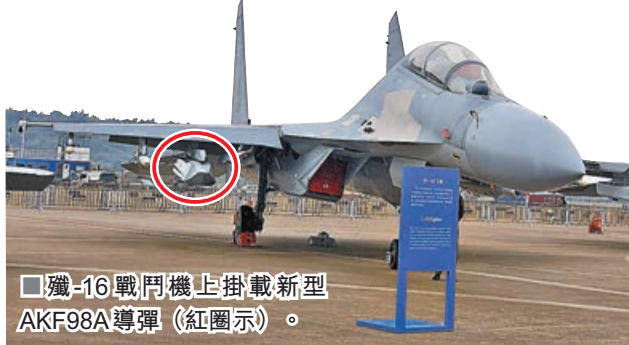
■殲-16戰鬥機上掛載新型AKF98A導彈（紅圈示）。

第十五屆中國航展（珠海航展）即將於12日揭幕，一批代表世界先進水平的「高、精、尖」展品將集體亮相。代表中國國防先進技術的「新一代地空導彈武器系統」紅旗-19、新型「隱形空射巡航導彈」AKF98A、「反航母撒手鐮」超聲速導彈YJ-12E等「大殺器」紛紛揭開面紗。其中，中國空軍展出的AKF98A具備現代隱形特性，可由殲-16D戰鬥機等攜帶，在需要「快速、出人意料的打擊」時凸顯優勢。