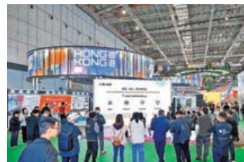
■第七屆進博會圓滿閉幕，香港展區備受關注。

進博會期間，復旦大學管理學院還與香港心腦血管健康工程研究中心（下稱「COCHE」）簽署戰略合作備忘錄。雙方將在陸港兩地及國際開展醫療科創平台