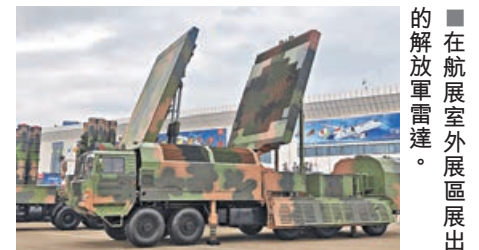
■在航展室外展區展出的解放軍雷達。