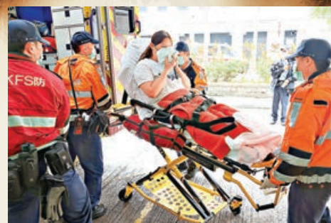
獲救女事主吸入濃煙，不適送院。

現場為柴灣道233號新翠花園1座5樓一住宅單位，火警中不幸死亡男子姓李（65歲），女傷者31歲，兩人是父女關係。據悉上址住有一家四口，包括李氏夫婦及一對子女，事發時僅得兩父女在家，其中女兒在房內睡覺，突驚聞父親呼救，於是奔出睡房始發現客廳火警，由於當時太大煙，只好返回房中待救。屋苑保安員及街坊發現上址單位