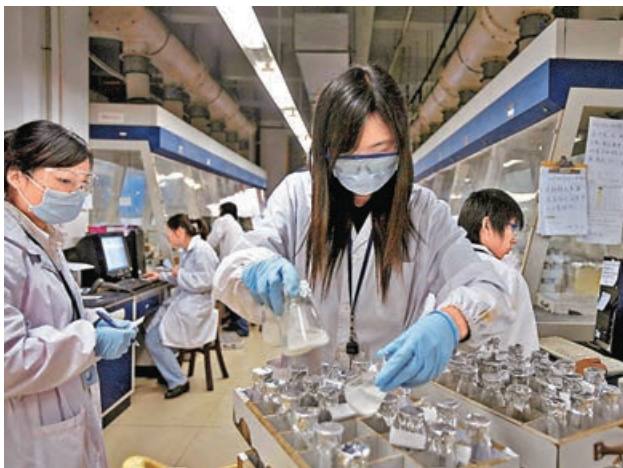
■藥明康德上周五勁升9.2%。圖為公司在無錫的生物醫藥實驗室。

另外，在第三季業績公布後普遍出現回吐回整的互聯網龍頭股，亦開始出現承接表現回好，其中，連跌了六日的美團(3690)終於回升2.01%，而騰訊(0700)也漲了1.82%至412.6元收盤，回升修復至11月中公布業績前的水平。指數股方面，藥明系股份繼續有突出表現，藥明康德(2359)漲了9.2%，藥明生物(2269)漲了5.47%，又再站到恒