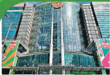
■深水埗西九龍中心9層商場中，竟有7層都開有夾公仔店。