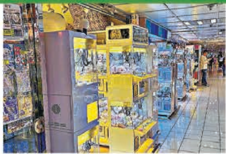
■屯門華都商場夾公仔店超過25間，大多連店名都無。