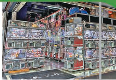
■香港三爪分店設在人來人往的旺角彌敦道。