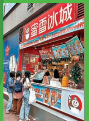
■蜜雪冰城首間香港分店設在旺角銀行中心。