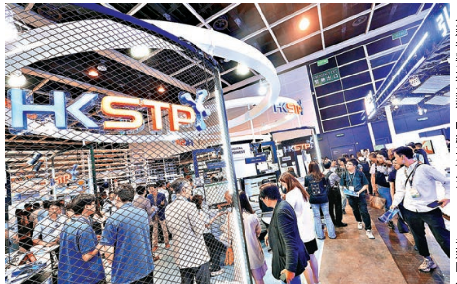
■創科行業大行其道，吸納大量人才。