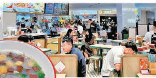
■店家供應多款上海地道美食，吸引不少打工仔幫襯。