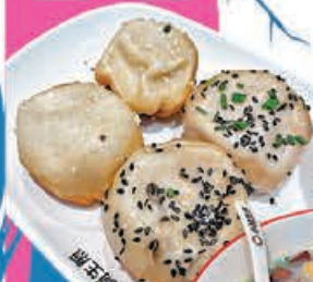
■大家食生煎包要非常小心，以免肉汁噴滿面。

此外，小楊生煎除了供應「特色酸辣粉」及「魚丸湯」，「鴨血粉絲湯」是品牌另一招牌貨，現時入夜後寒風刺骨，小編推薦嘆¥19的「藤椒鴨血粉絲湯」暖身，滿滿配料包括鴨血、鴨腎、鴨胸、鴨腸、分量不少，鴨血潤滑順滑有天然潤質感，鴨胸有鴨肉鮮香而絕無半點鴨膻味；至於粉絲吃起來有嚼勁，入口質感令人食慾大增；而湯底的藤椒味恰到好處，喝完湯讓人感到鴨湯的原汁原味，藤椒的微辣在初冬令寒意一掃而空。