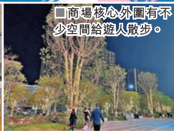
■商場核心外圍有不少空間給遊人散步。

深圳各區新商場越開越旺，早前開業的坂田萬科廣場仿效新加坡樟宜機場的自然生態模式，以沉浸式場景設計出多個動物打卡點，包括最具代表性IP、10米高的黑臉琵鷺及「豹貓」雕塑，再以大量植物打造的森林中庭，如同經典電影《阿凡達》的「生命之樹」，入夜後閃閃發亮，配合超巨型屏幕LED瀑布，場面震撼，吸引不少港人北上探秘這個「城市綠洲」，啟動治癒心靈之旅！