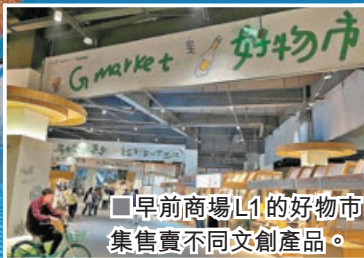
■早前商場L1的好物市集售賣不同文創產品。