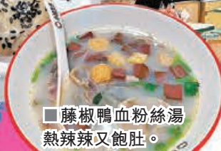
■藤椒鴨血粉絲湯熱辣辣又飽肚。